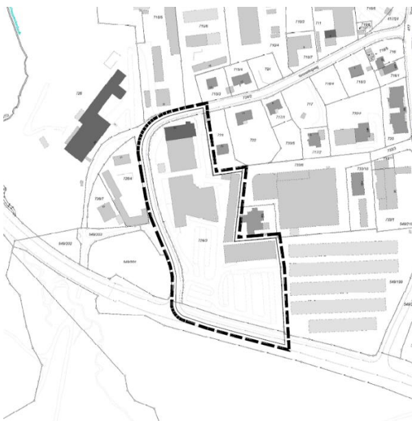
Geltungsbereich – Auszug Lageplan

Der Ausschuss für Stadtentwicklung und Verkehr der Stadt Passau hat in seiner Sitzung am 10.07.2019 o.a. Bebauungsplan gebilligt.